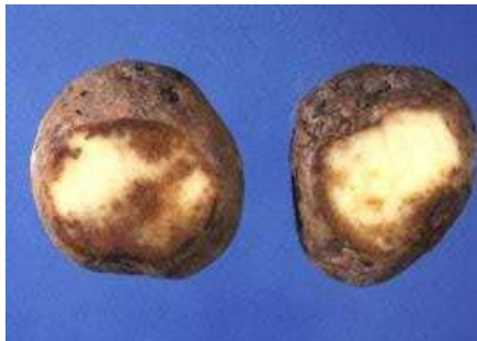
Figuur 1: Aardappels geïnfecteerd met Phytophthora . Eet smakelijk!

In het practicum van 'Prenataal' onderzoek bij planten heb je onderzocht of jouw aardappelplantje een resistentiegen heeft tegen aardappelmoeheid. Deze ziekte wordt veroorzaakt door het aardappelcystenaaltje. Maar een aardappelplant heeft nog veel meer vijanden. Onkruiden concurreren met aardappelplantjes om licht, water en voedingsstoffen. Daarnaast worden aardappelplanten aangevallen door allerlei verschillende insecten, schimmels, bacteriën en virussen. Maar de grootste bedreiging voor een aardappelplant is toch wel de aardappelziekte fytoftera.