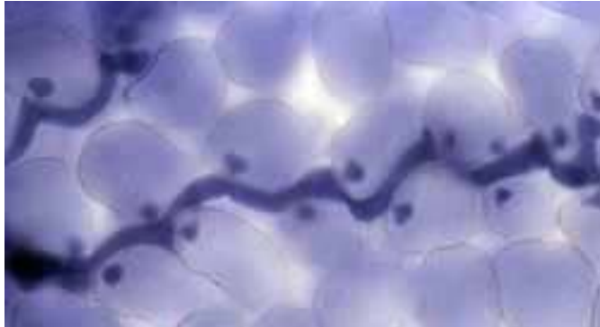
Figuur 3: Microscopische opname van haustoria in bladcellen. De hyfe groeit tussen de bladcellen door. Dit is overigens niet P. infestans , maar een andere oömyceet (valse meeldauw in Arabidopsis thaliana ).

Voor de vorming van een netwerk van hyfen (mycelium) is veel energie nodig. In het blad vormen de hyfen daarvoor speciale structuren. Een hyfe dringt plaatselijk de plantencel binnen en vormt daar een soort ballonnetje, het haustorium. Met dit haustorium zuigt de ziekteverwekker de voedingsstoffen van de gastheer op voor eigen gebruik. Op deze manier kan Phytophthora steeds verder groeien ten koste van de plant.